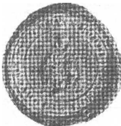
Obrázok 6 Pečať Hronskosvätobeňadického benediktínskeho konventu