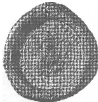
Obrázok 5 Menšia pečať Nitrianskej kapituly