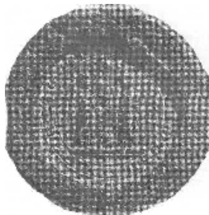
Obrázok 7 Pečať premonštrátskeho konventu zo Šiah