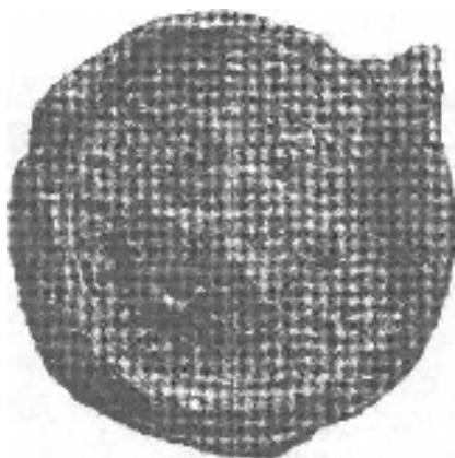
Obrázok 4 Pečať Bratislavskej kapituly