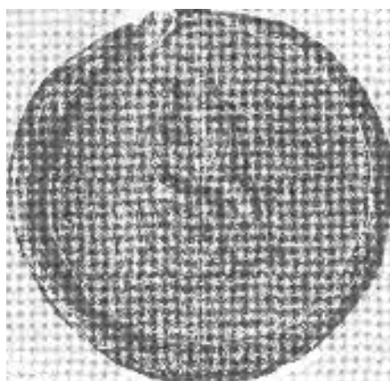
Obrázok 8 Pečať Turčianskeho konventu