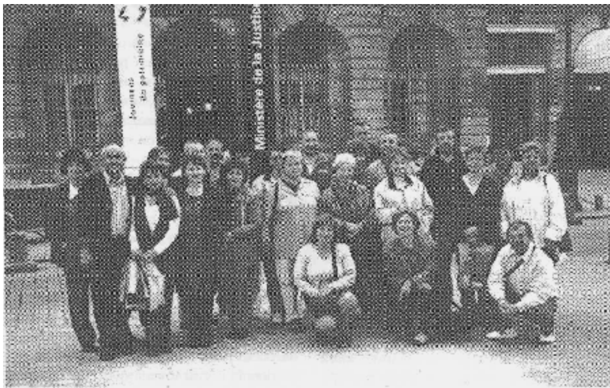
Naši notári pred budovou Ministerstva justície v Paríži

V treťom roku svojej obnovenej existencie,