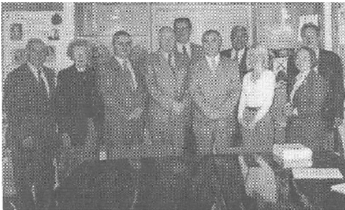
Členovia Správnej rady Medzinárodného inštitútu histórie notárstva

Za symbol si inštitút zvolil technický prístroj - gnómon, ukazujúci presný čas. Slovo „gnómon“ je gréckeho pôvodu. Keďže v minulosti merateľom času boli iba slnečné hodiny, ktoré ukazovali presný čas iba na pravé poludnie, bol vyvinutý prístroj na vysokej technickej úrovni, ktorý ukazuje presný čas stále. Presnosť si už za čias Ľudovíta XIV. notári vybrali za charakteristickú črtu svojej notárskej činnosti. Symbolom - logom sa stal „gnómon“. Podľa neho aj nazvali časopis inštitútu - Le Gnómon. Princíp notárskej činnosti postupne nadobudol teologicko-filo-